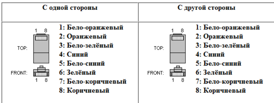
Схема обжимки кабеля подключения пульта Savitr «Pult»

Схема обжимки сетевого кабеля (витой пары RJ-45) соответствует стандарту EIA/TIA-568B.